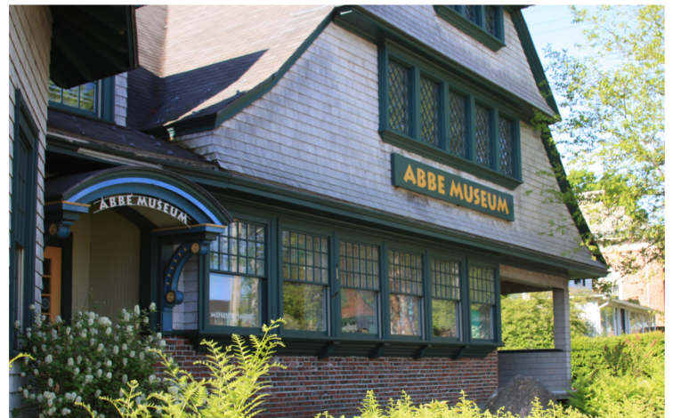
Nella foto: esterno del centro del Museo Abbe