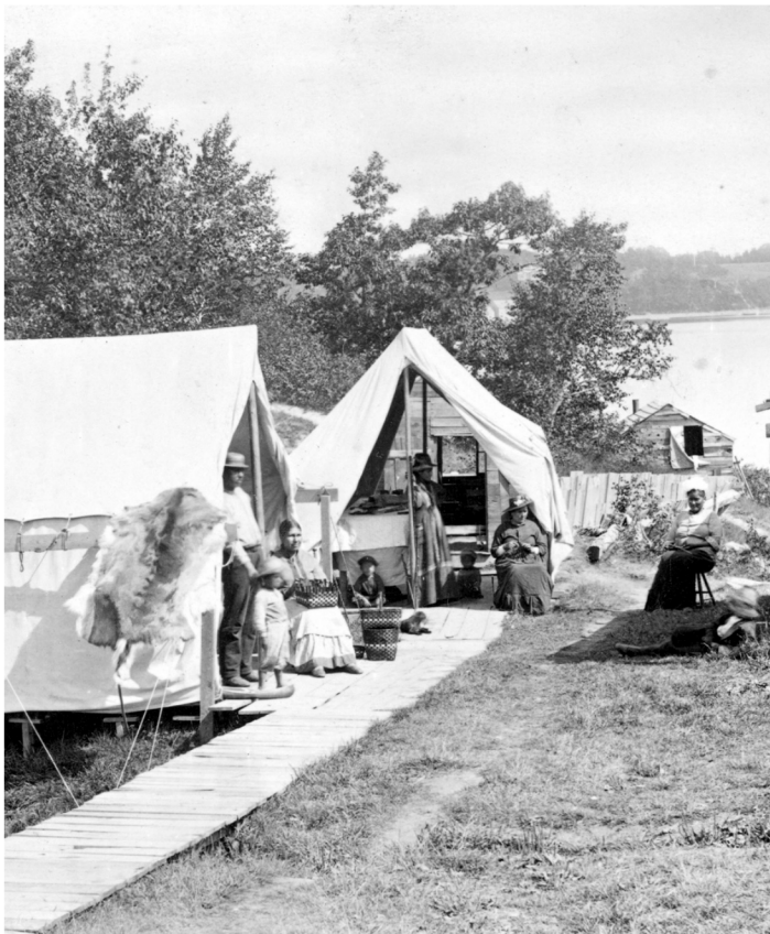
Nella foto: accampamento Wabanaki a Bar Harbor, Maine

Con l'avvento degli Stati Uniti, il turismo nel Maine, in particolare a Mount Desert Island, aumentò e i Wabanaki, che avevano sempre vissuto sull'isola, iniziarono a modificare il loro stile di vita tradizionale. Per attirare il mercato turistico, i Wabanaki si recavano nelle città più grandi dell'isola, come Bar Harbor e Southwest Harbor, durante la stagione estiva per vendere cesti e perline e per fare da guide per la caccia e la pesca.