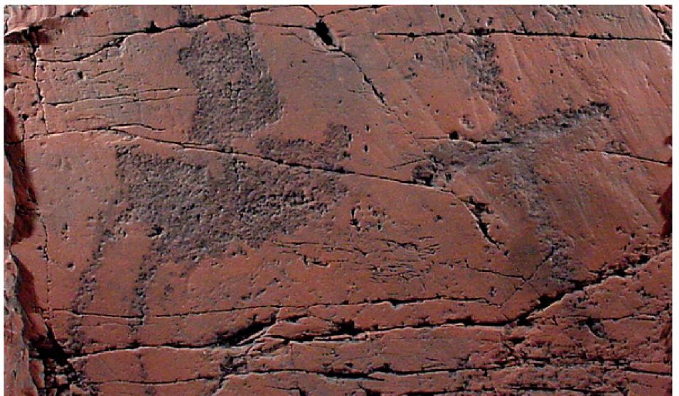
Nella foto: petroglifi Wabanaki

A metà del 1500, i coloni europei cominciarono ad arrivare nella regione, inizialmente per pescare, ma in seguito, in numero maggiore, per stabilirsi. Il loro arrivo ebbe un impatto significativo sulle comunità native, introducendo nuovi materiali per il commercio e malattie che uccisero oltre il 90% della popolazione in alcune aree e influenzano cambiamenti nei modelli di sussistenza.