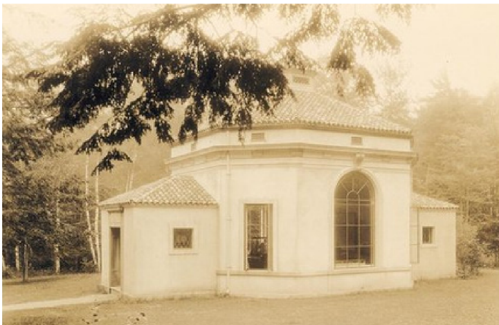
Nella foto: Foto storica del Museo dell'Abate a Sieur de Monts

Negli anni '90, i 2.000 metri quadrati del museo di Sieur de Monts Spring erano diventati inadeguati per ospitare le collezioni in crescita e non offrivano spazio per i programmi al chiuso, le mostre in evoluzione e la ricerca. Nel 1997, l'Abbe ha acquistato l'ex edificio YMCA nel centro di Bar Harbor. Inaugurato nel 2001, l'Abbe Museum Downtown si concentra sulla storia e sulla vita contemporanea, sulle comunità e sull'arte delle quattro tribù del Maine riconosciute a livello federale: i Maliseet, i Mi'kmaq, i Passamaquoddy e i Penobscot, noti collettivamente come Wabanaki.